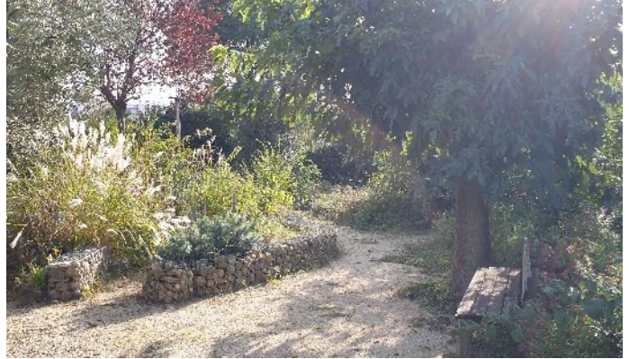
Les jardins partagés

En savoir plus sur le site internet PRU Valence :