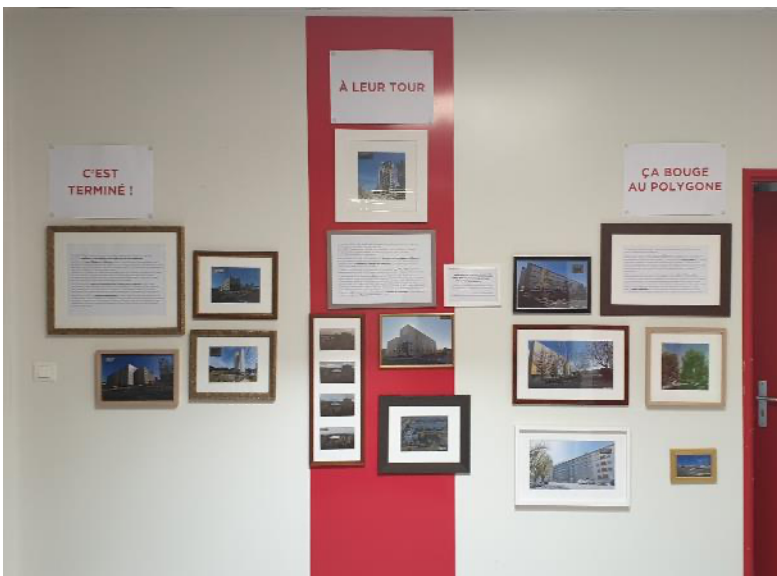
La maison du projet, dans les locaux de la Maison Pour Tous