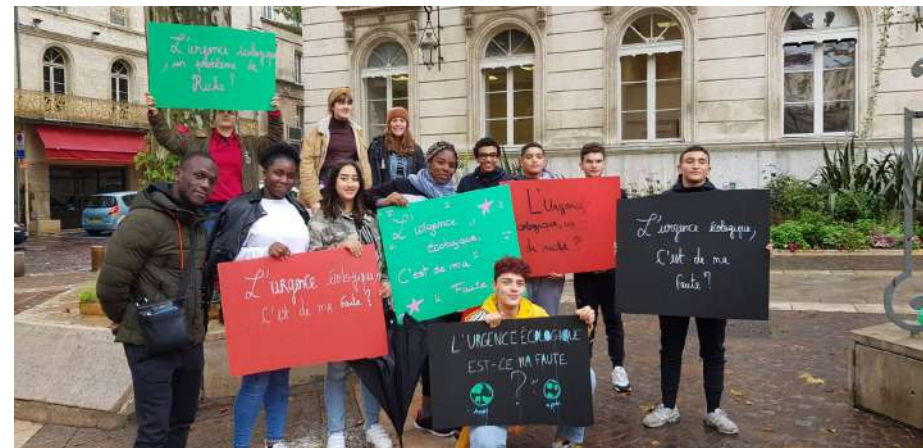
FCSF 2019 : Urgence écologique les jeunes s'engagent pour l'environnement