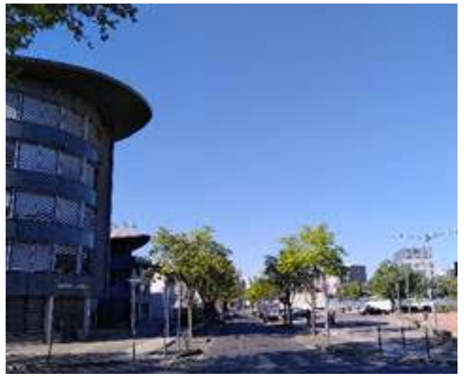
Mermoz - place Latarjet