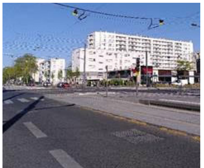
Etats-Unis - carrefour place 8 mai 1945