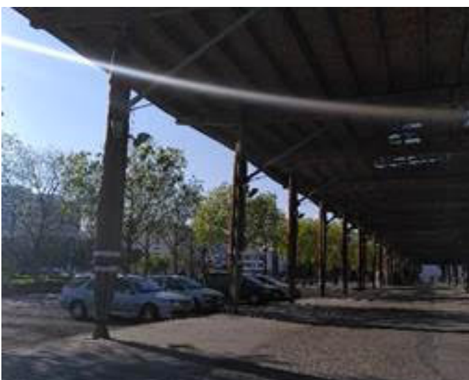
Etats-Unis - halle du marché