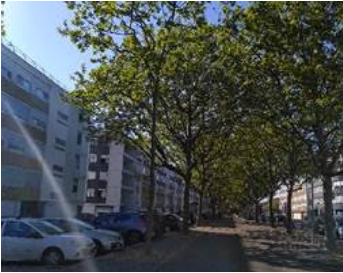
Mermoz - mail narvik